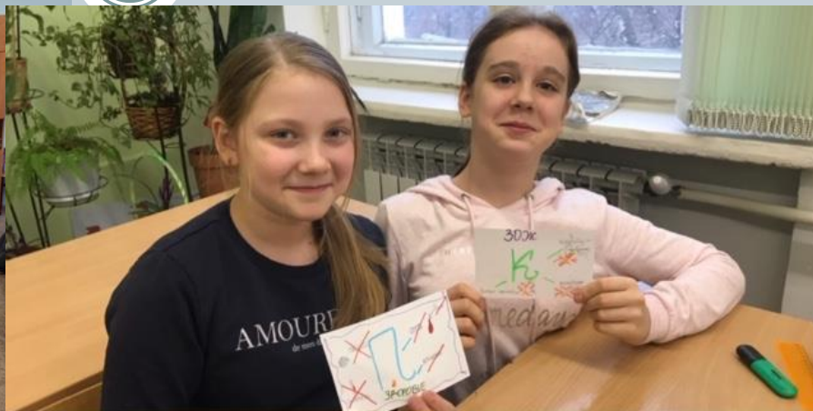
Акция «АЗБУКА ЗДОРОВЬЯ»